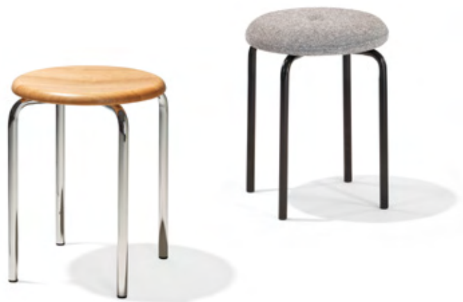
bis 8 Stück stapelbar